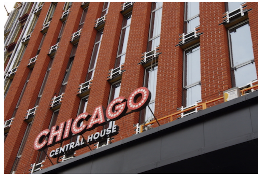
ЖК «Chicago Central House»