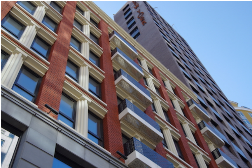
ЖК «New York Concept House»