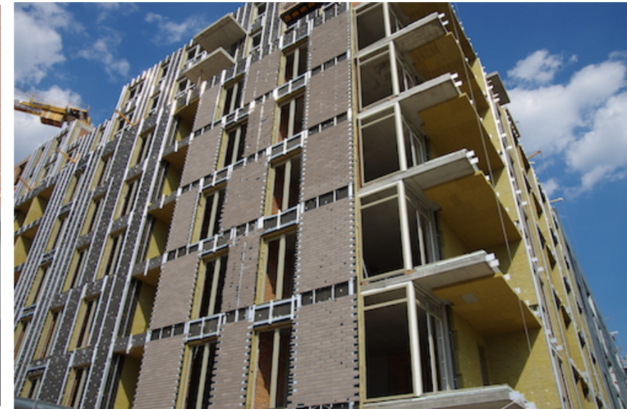
Житловий район Rybalsky